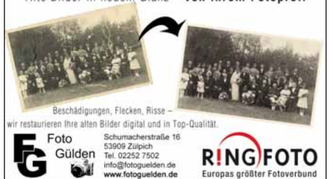
BILD-RESTAURIERUNG Alte Bilder in neuem Glanz – von Ihrem Fotoprofi

Am Meilenstein 1 • 53909 Zülpich Tel.: 02252-2230 • Mobil 0172-2939065 w.klumpen-malerwerkstatt@gmx.de