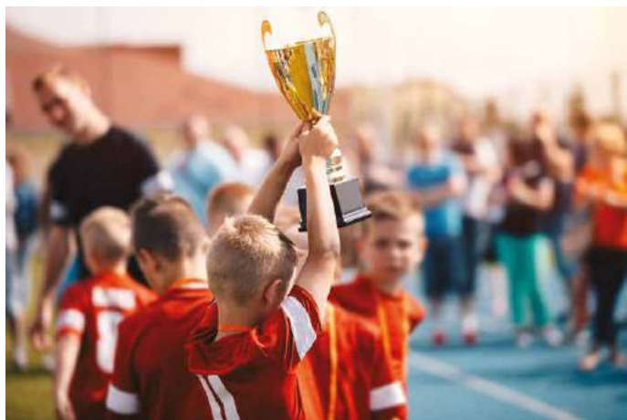
Bei der Sportlerehrung 2024 sollen Sportlerinnen, Sportler und Mannschaften geehrt werden, deren Erfolge im Jahr 2023 errungen wurden.

Die Ehrung kann Sportlerinnen, Sportlern und Mannschaften zuteil werden, die in Zülpich ihren ständigen Wohnsitz haben oder die ihre Erfolge als Starter in einem Zülpicher Verein oder als Schülerin und Schüler einer Zülpi-