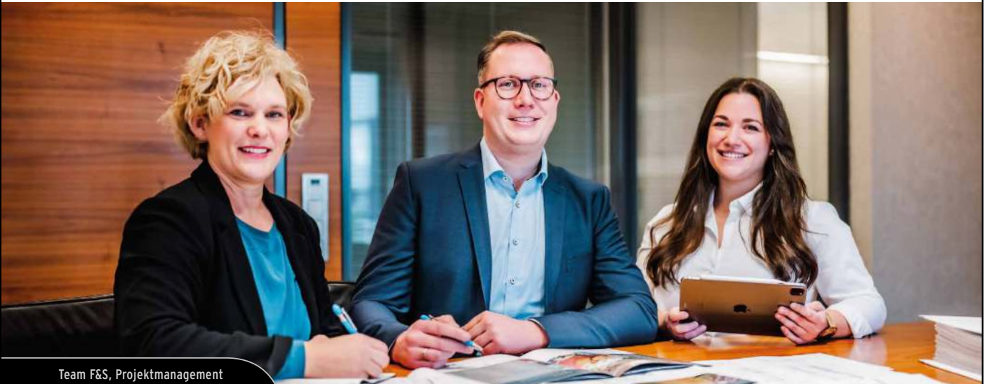
Team F&S, Projektmanagement