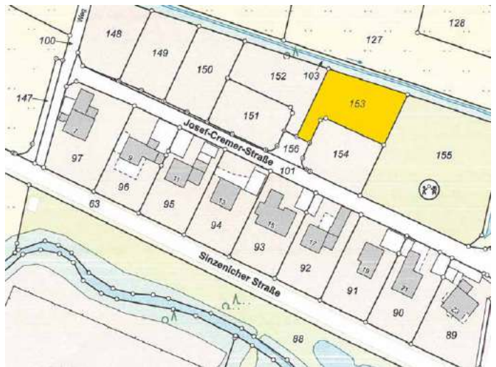
Bei dem freien Baugrundstück im Merzenicher Neubaugebiet „Auf dem Kittel“ handelt es sich um das 576 Quadratmeter große, in dieser Karte gelb eingefärbte Flurstück 153. Grafik: Stadt Zülpich

Interessenten können sich für weitere Informationen unter Tel. 02252-52256 oder per E-Mail an sez@stadt-zuelpich.de an die SEZ-Prokuristin Judith Fuchs wenden.