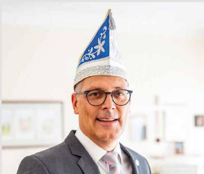
3 x Zöllech Alaaf!

Den Närrinnen und Narren wünsche ich tolle Umzüge und ausgelassene harmonische Feste!