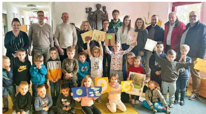
Die Katholische Kindertagesstätte „Im Wingert“ und hier konkret das Projekt „Sensibilisierung für Schöpfungserhalt durch Biodiversitätsförderung“ wurde mit dem 2. Platz beim Klimaschutzpreis 2023 ausgezeichnet.