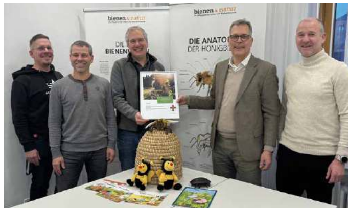
Der 3. Platz beim Klimaschutzpreis 2023 ging an den in Zülpich-Nemmenich beheimateten „Bienenzuchtverein Euskirchen und Umgebung“ für das Projekt „Bienenerlebniskisten für Kindergärten und Grundschulen“.

Seit 1995 macht der Westenergie-Klimaschutzpreis regelmäßig zahlreiche gute Ideen und vorbildliche Aktionen aus dem lokalen und regionalen Umfeld für die Öffentlichkeit sichtbar. Er regt damit auch zum Nachahmen an und macht Mut, selbst aktiv zu werden. Insgesamt wurden bereits mehr als 7.000 Projekte mit dem Klimaschutzpreis ausgezeichnet.