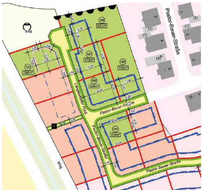
Im Neubaugebiet „Bachsteinweg“ in Zülpich sind die in der Karte grün eingefärbten Flurstücke 151, 181, 185, 186, 187 und 188 zurzeit noch käuflich zu erwerben. Grafik: Stadt Zülpich