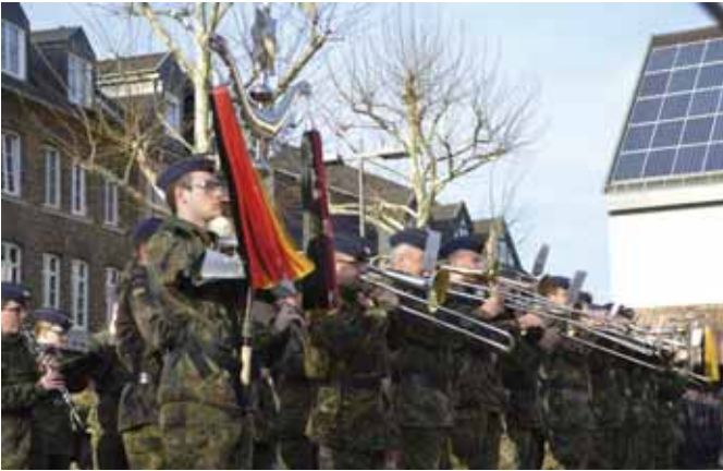
Das Luftwaffenmusikkorps 3 aus Münster sorgte für die würdige musikalische Umrahmung des Abschiedsappells.