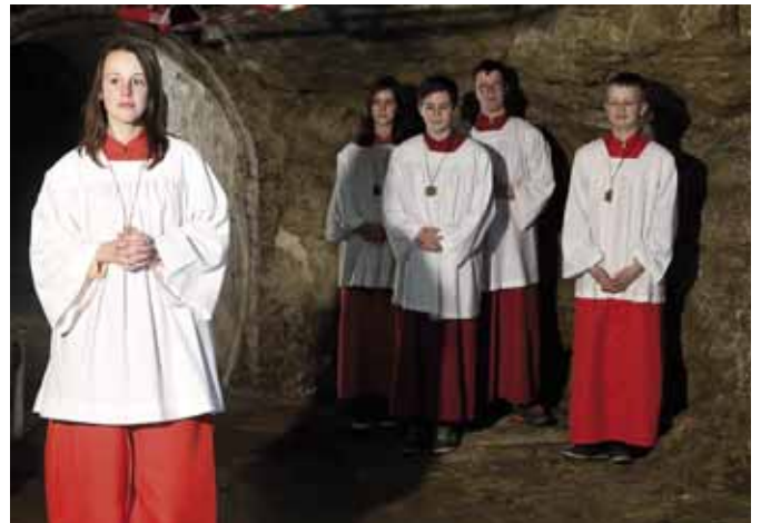
Eine der zahlreichen, an 89 Drehtagen entstandenen Aufnahmen Rolf A. Klunters zeigt Messdiener/innen der örtlichen Pfarrkirche St. Stephanus im Felsenkeller.